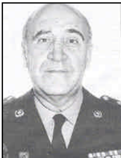
Justo Oreja Pedraza

El general Justo Oreja Pedraza , murió el día 28 de julio de 2001, tras un mes de agonía al resultar gravemente herido por el estallido de un paquete bomba colocado por ETA. El explosivo fue activado en torno a las 8:30 horas de la mañana, del día 28 de junio de 2001, momento en que el militar salía de su domicilio en la calle López de Hoyos. El general sufrió quemaduras en la cara y en el tórax y múltiples heridas por metralla en todo el cuerpo. Además en el atentado resultaron heridas otras dieciséis personas.