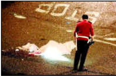
Lugar del atentado

tras su compañero, afiliado a UGT, pereció poco después.